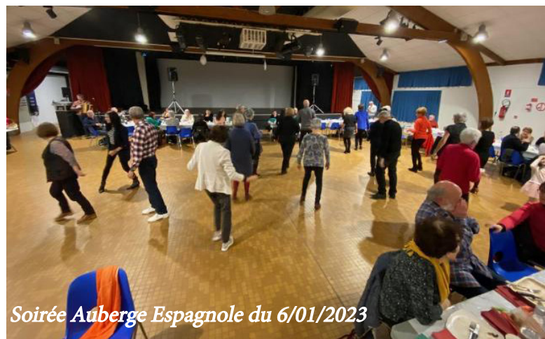
Soirée Auberge Espagnole du 6/01/2023

La fête de fin d'année se prépare. Elle aura lieu le 23 juin et sera marquée par les trente ans de l'association.